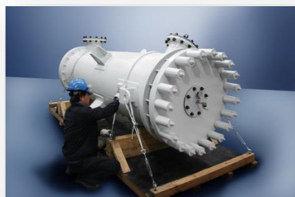
Холодильник слабой кислоты