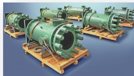
Подогреватель травильного раствора HCl