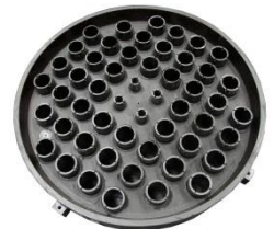
Тарелка GT-KELITE для дистилляционной колонны