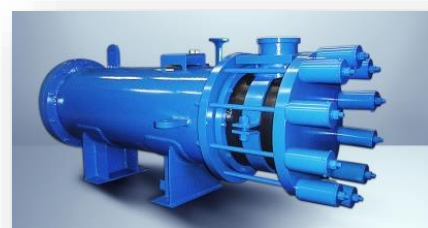
Реактор / конденсатор для ксилола / тионилхлорида