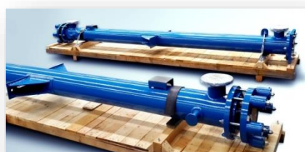
Холодильник серной кислоты 85 % - 160 °C